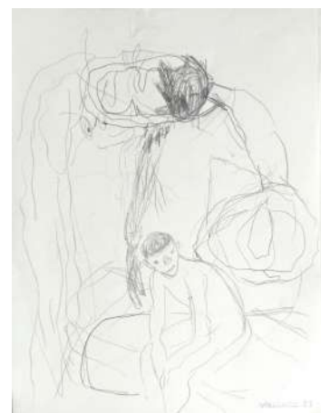
Vicente Blanco, S/T da serie Os coleccionistas de formas , grafito sobre papel, 28,5 x 21 cm, 2023.