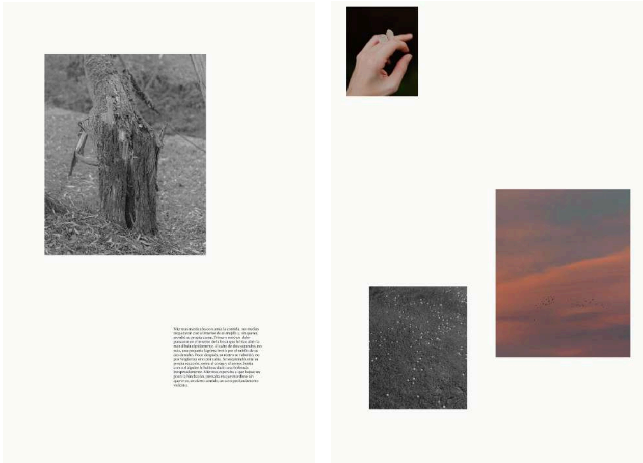
Sabela Eiriz, ST da serie Un lugar desprazado coma o meu corpo , fotografía dixital, Impresión en tintas pigmentadas sobre papel de fibras naturais 210g, 91 x 61 cm, 2024

Para Sabela Eiriz (Lugo, 1991) a potencia da fotografía non radica só na estética, senón na capacidade que ten de suxerir e dar forma as súas ideas. Sabela é unha artista multidisciplinar que traballa fundamentalmente coa fotografía, a escritura e o vídeo, cunha linguaxe baseada na poética, nas posibilidades expresivas das imaxes e na hibridación de formas e formatos. No seu traballo, combina unha aproximación conceptual cun hábito contemplativo, entrelazando experiencia, pensamento e emoción. A memoria, o tempo, a identidade, así como a metarreflexión sobre a imaxe e os procesos creativos, son protagonistas habituais nos seus proxectos.