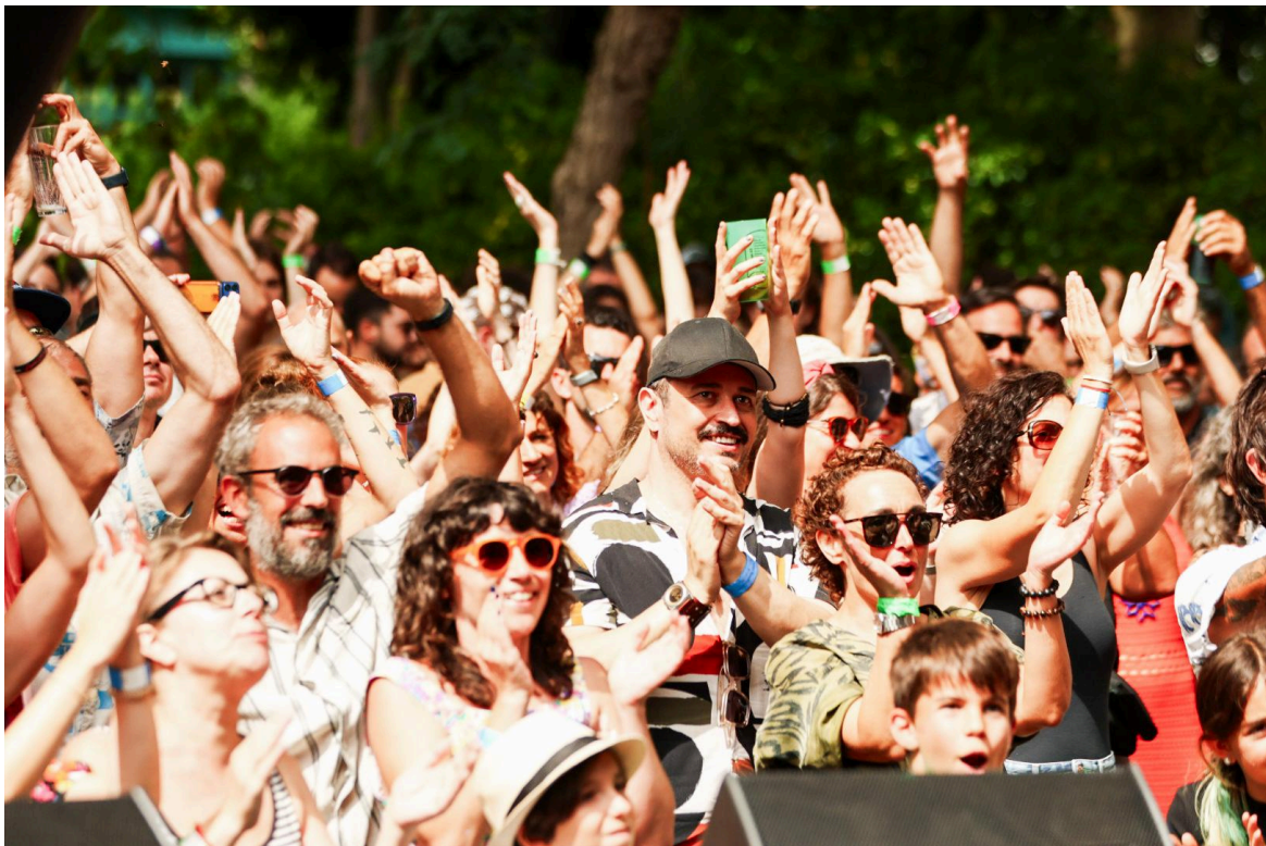
Público asistente ao Sinsal SON Estrella Galicia 2023

O evento, un dos festivais máis singulares da tempada estival, activou este luns 13 a venda de entradas e, 24 horas despois, unicamente dispón de billetes para o venres 26