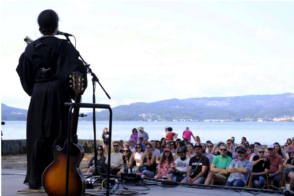
Concerto de Jesca Hoop no Sinsal 2023

As entradas por día poderanse adquirir a partir do 13 de maio en Enterticket, a mesma plataforma web na que estarán dispoñibles os abonos